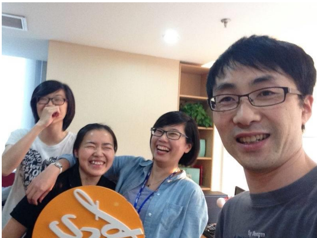
同事們都很照顧我，大家相處融洽