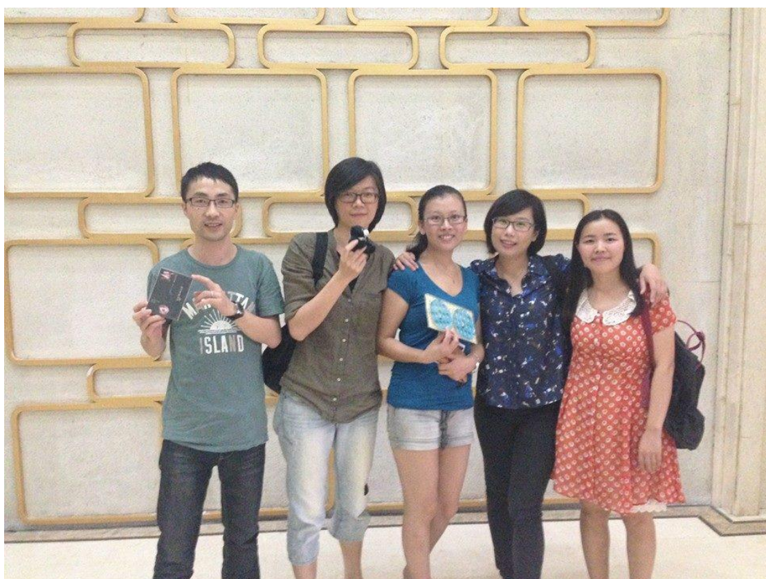
離別前與同事們的餞行宴