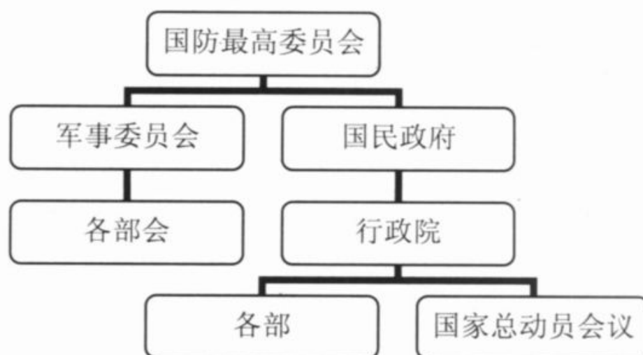
圖 2 示：國民政府戰爭動員系統 12

制”，確立了“設計——執行——考核”三程式，對這一戰時組織體制進行了進一步完善，在各個地方，具體的行政組織系統表現為“省政府——專員公署——縣政府——聯保——保——甲——戶，而以省、縣、聯保三級為主要樞紐，以保甲為基礎。 11 至此，蔣介石領導的戰時政府組織設置完全設立並運行起來。