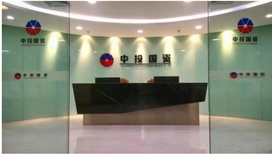
中投國資基金管理有限公司